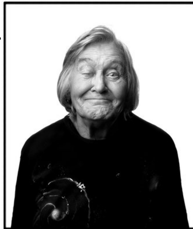
Sono qui per discutere