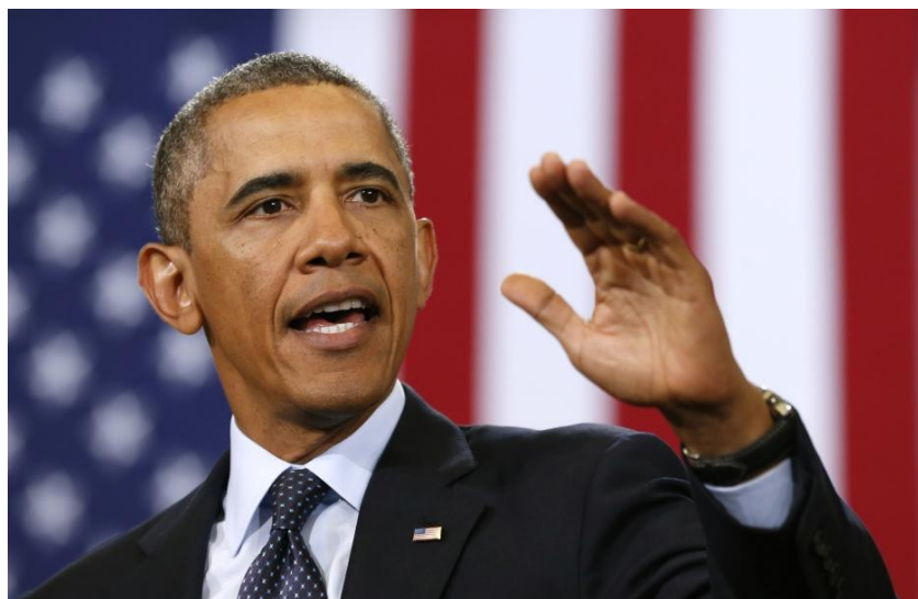
Sono qui per parlare alla Nazione