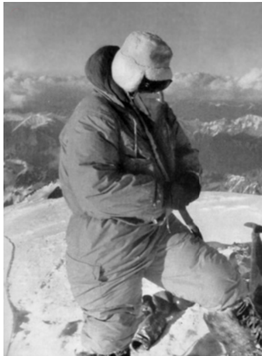
Sono qui per scrivere la storia