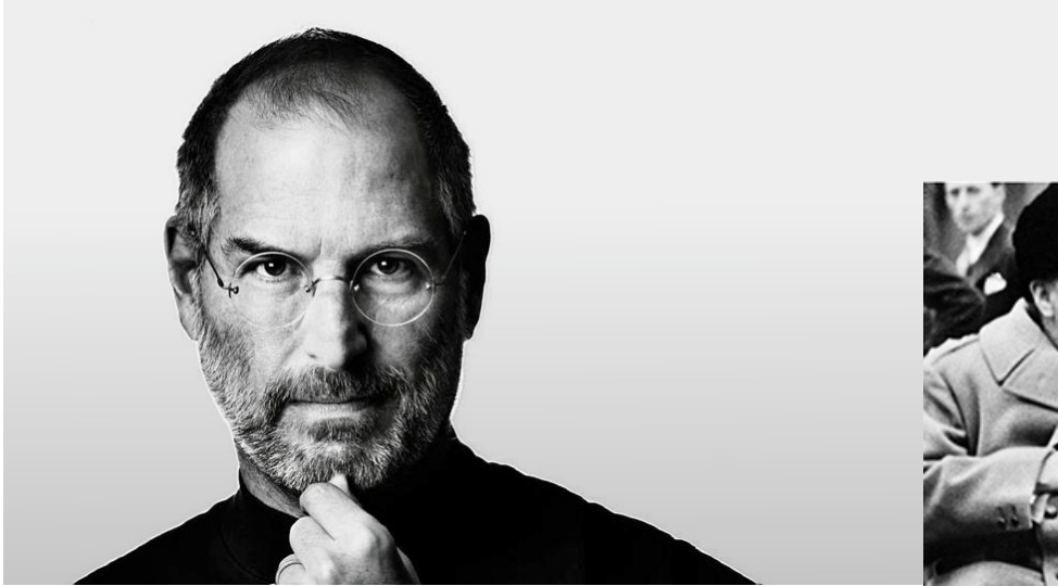
Sono qui per scrivere la storia