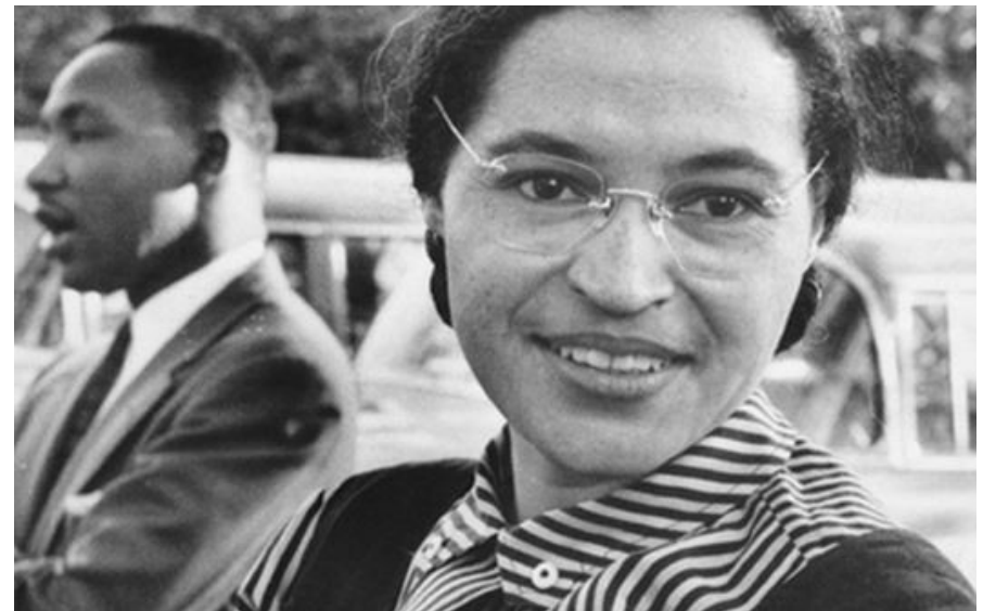
Sono qui per scrivere la storia