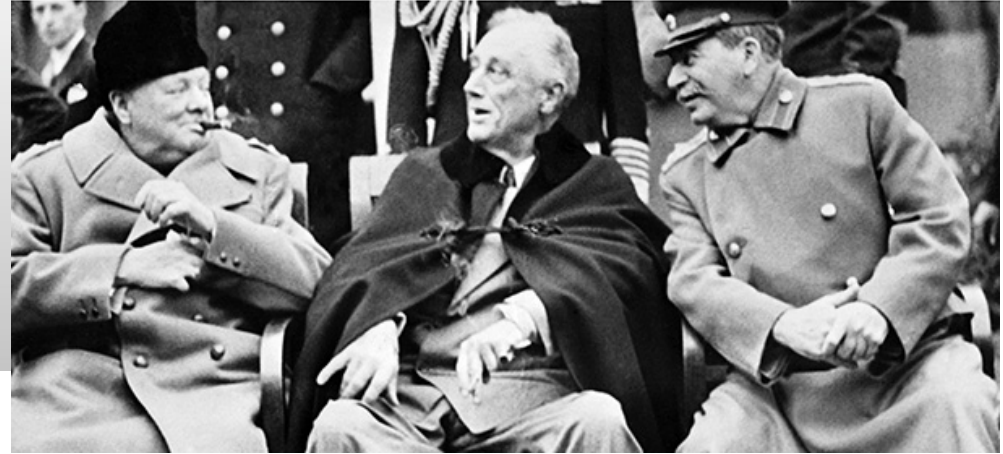
Siamo qui per scrivere la storia