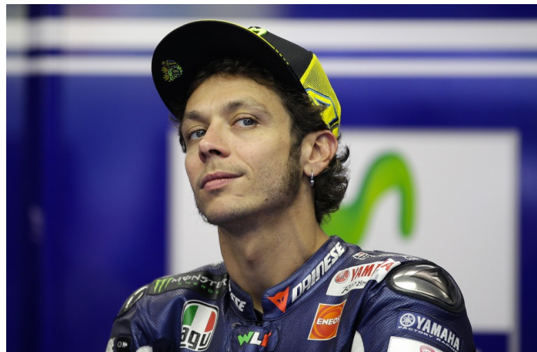
Sono qui per gareggiare