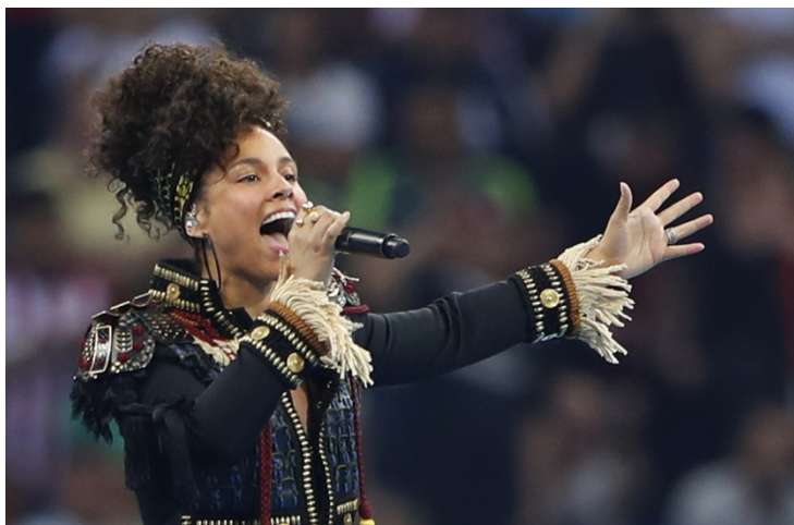
Sono qui per cantare alla finale di Champions